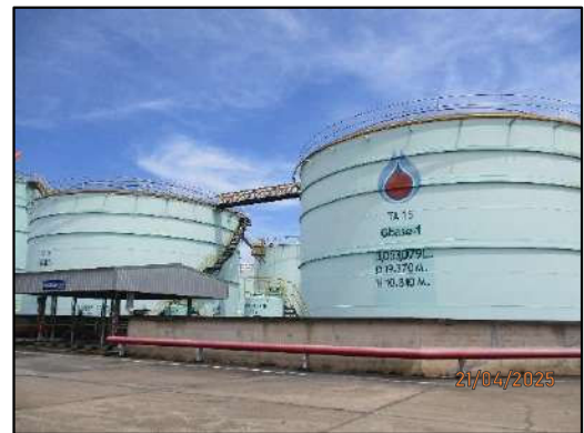
คลังน้ำมัน