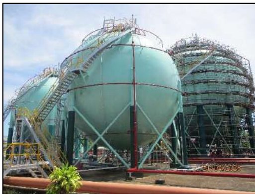
คลังก๊าซปิโตรเลียมเหลว

3.2) ท่าเทียบเรือขนถ่ายก๊าซปิโตรเลียมเหลว อยู่ห่างจากท่าเทียบเรือขนถ่ายน้ำมันประมาณ 30 เมตร มีลักษณะเป็นสะพานเทียบเรือ (Jetty) รูปตัวที ยื่นออกไปในแม่น้ำตาปีทางทิศเหนือ ระยะห่างจากฝั่ง 20 เมตร ความยาวท่าเทียบเรือรวมหลักเทียบเรือ 36 เมตร ความยาวระหว่างพุกผูกเรือ 83 เมตร ความลึกเฉลี่ยของหน้าท่าลึก 4.5 เมตร จากระดับน้ำต่ำสุด สามารถรับเรือขนาดไม่เกิน 1,250 ตันกรอสส์ และเรือที่จะเข้าเทียบท่าต้องมีความยาวตลอดลำไม่เกิน 65 เมตร กรณีท่าเทียบเรือมีเรือเทียบท่าอยู่ก่อนแล้ว เรือที่จะเข้าเทียบท่า ต้องมีความยาวตลอดลำไม่เกิน 61 เมตร โดยบริเวณท่าเทียบเรือขนถ่ายก๊าซปิโตรเลียมเหลวประกอบด้วย สะพานท่าเทียบเรือ หลักผูกเรือ หลักปะทะ พื้นที่ปฏิบัติงาน (Platform) และระบบท่อที่ใช้ในการขนถ่ายก๊าซปิโตรเลียมเหลวขนาดเส้นผ่าศูนย์กลาง 6 นิ้ว จำนวน 1 ท่อ และเส้นผ่าศูนย์กลาง 4 นิ้ว จำนวน 1 ท่อ