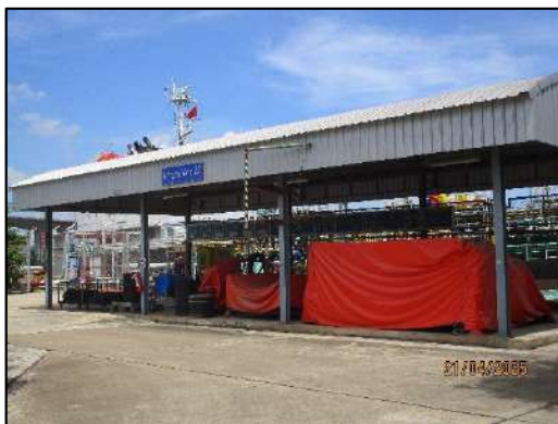
โรงเก็บอุปกรณ์กำจัดคราบน้ำมัน