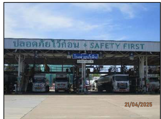
โรงจ่ายน้ำมัน