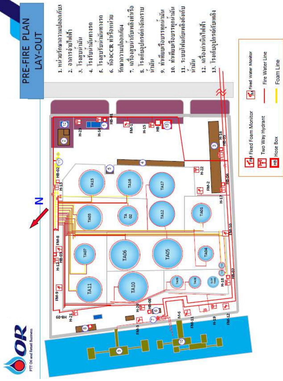
รูปที่ 1.4-2 แผนผังที่บริเวณคลังน้ำมัน